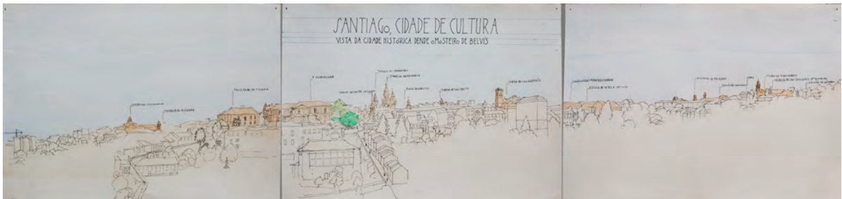
Dibujo en exposición El Correo Gallego

El objetivo del taller es introducir al alumnado en el conocimiento del entorno que nos rodea, en el que disfrutamos y sufrimos. De la arquitectura que usamos, de la historia que escriben los documentos que componen y articulan nuestras ciudades.