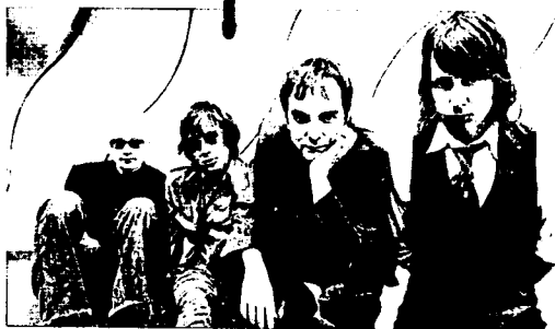
La banda norteamericana Fountains of Wayne toca hoy en Capitol

El nuevo disco sigue la senda de reimaginar los jangles de los primeros 60, la psicodelia de finales de los 60, el rock clásico de los 70, el new wave, el rock alternativo y el pop contemporáneo con su estilo inimitable.