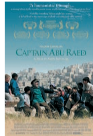
CAPITÁN ABU RAED

*Todas as proxeccións son en V.O. subtitulada.