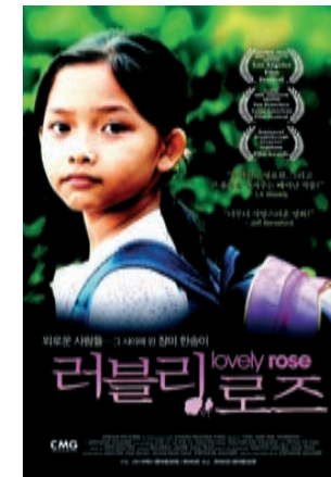
CINCO DÍAS EN SAIGÓN

ARGUMENTO: Ambientada en Berlín, cidade pantasma, inmediatamente despois da caída do Terceiro Reich, a película conta a historia de Edmund Koeler, un neno que vive na maior dificultade. Como moitos outros habitantes dese silencioso cúmulo de cascallos en que se converteu a cidade, Edmund percorre os edificios destruídos en busca de alimentos para a súa familia, de quen é o único sustento.