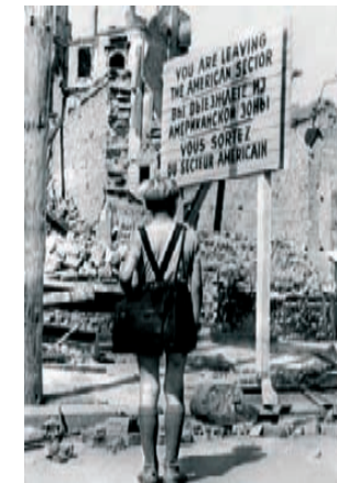
ALEMANIA, ANO CERO

ARGUMENTO: Baixo a dirección dun ecléctico grupo composto por algúns dos cineastas máis imaxinativos do noso tempo, a película convídanos a penetrar na intimidade das vidas dos neiorquinos. Unha prostituta, un home de negocios, unha discapacitada, unha parella de anciáns... todos eles atopan o amor, porque todo é posible na cidade que nunca durme.