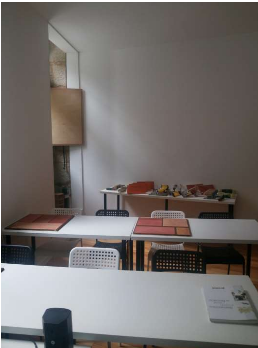
Estudio en el casco vello de Vigo.

VISITA A OBRA MÓDULO 5. REHABILITACIÓN DE EDIFICIOS PARA VIVIENDAS EN EL CASCO VELLO DE VIGO. PREMIOS COAG XV 2012.