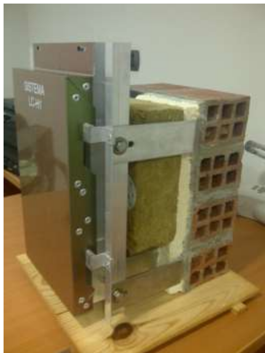
Muestra de fachada trasventilada del edificio de viviendas de Castelao 71.