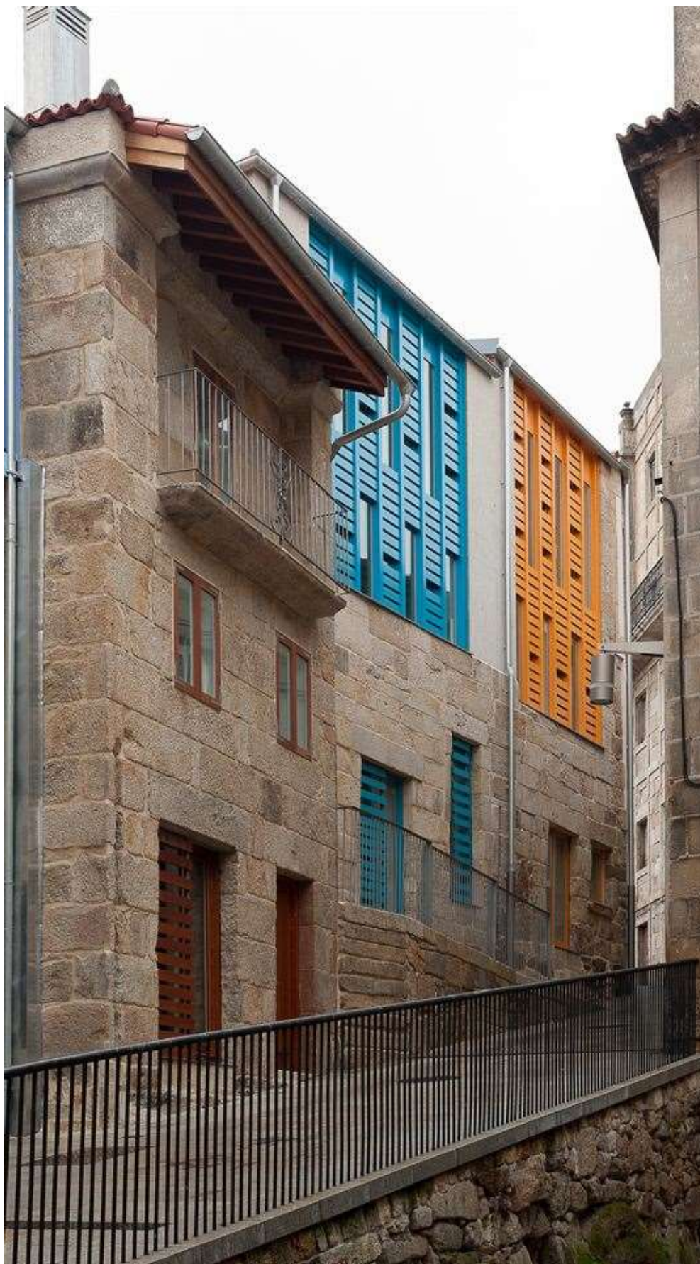
Casco vello de Vigo. PREMIOS COAG XV 2012.