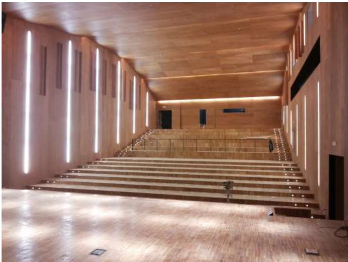
Módulo 4. Auditorio de Torroso.