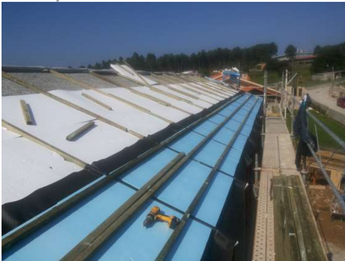
Módulo 3. Vivienda unifamiliar en Zamanes.