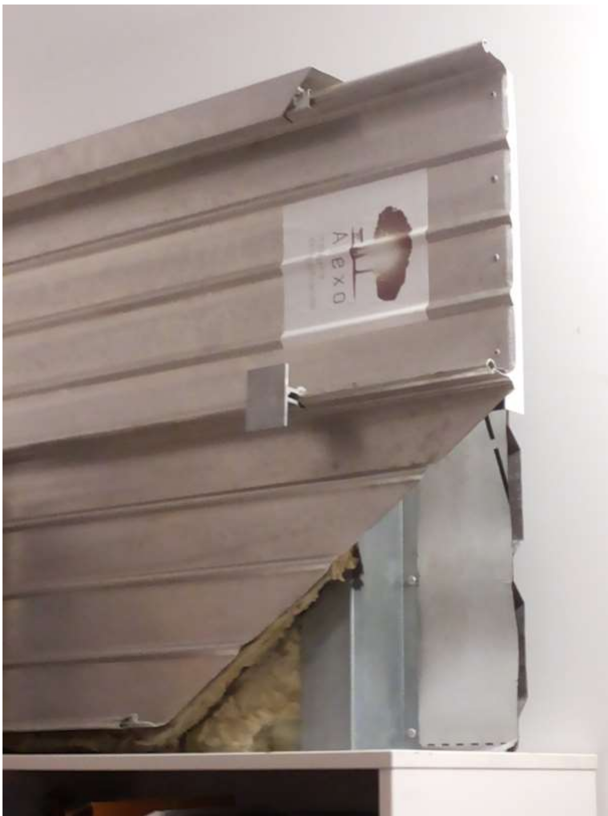
Maqueta de traballo 1/1. Fachada o cuberta de bandeja perfilada de aluminio Kalzip.