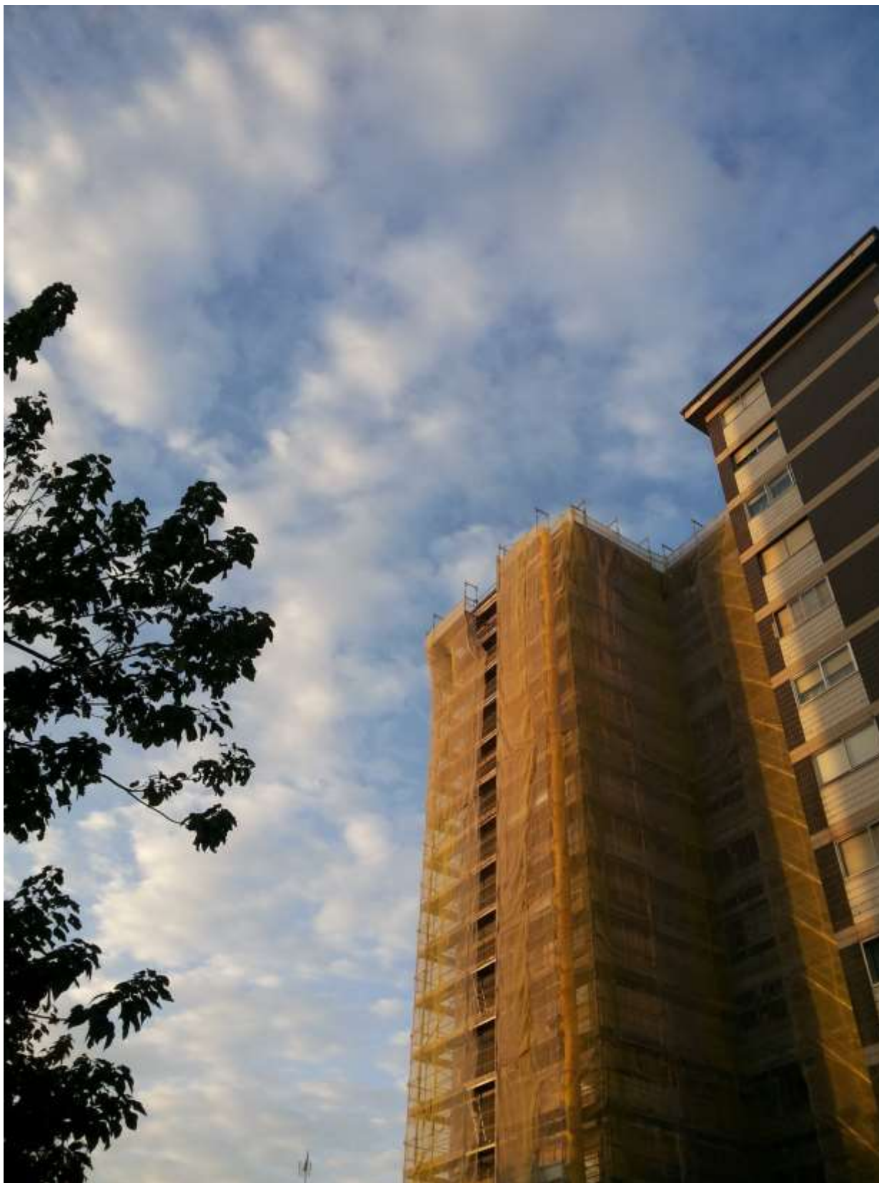
Módulo 2. Edificio de viviendas Castelao 71.