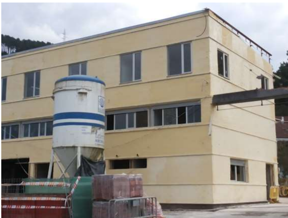
Termoenfocado a la espera trasventilada en el Parque Central de Bomberos.