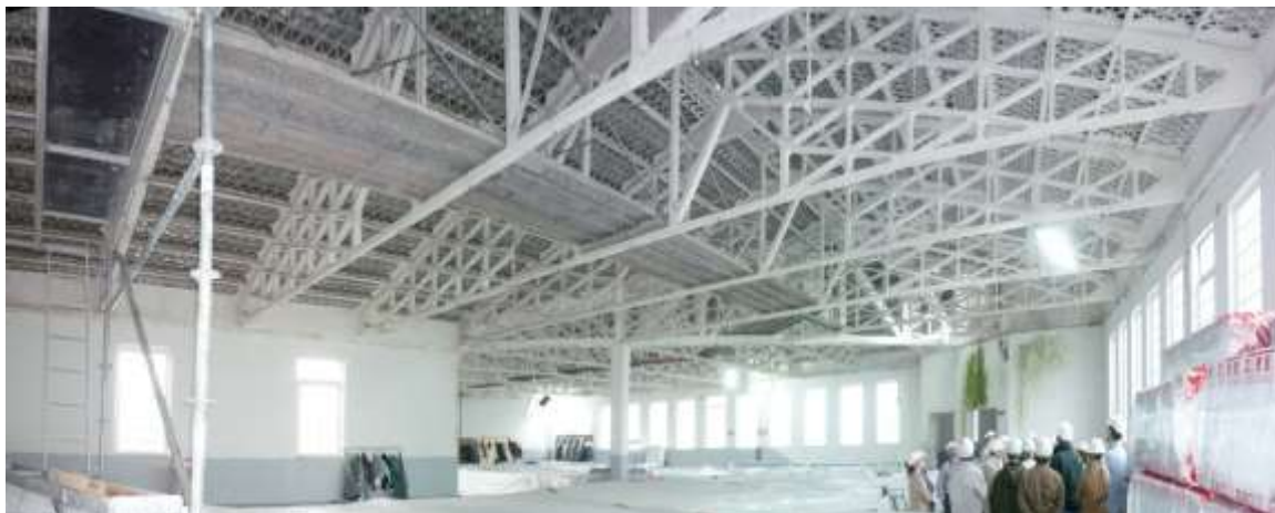
Taller de eficiencia energética en el mercado de Tomiño. Aislamientos reflectivos.