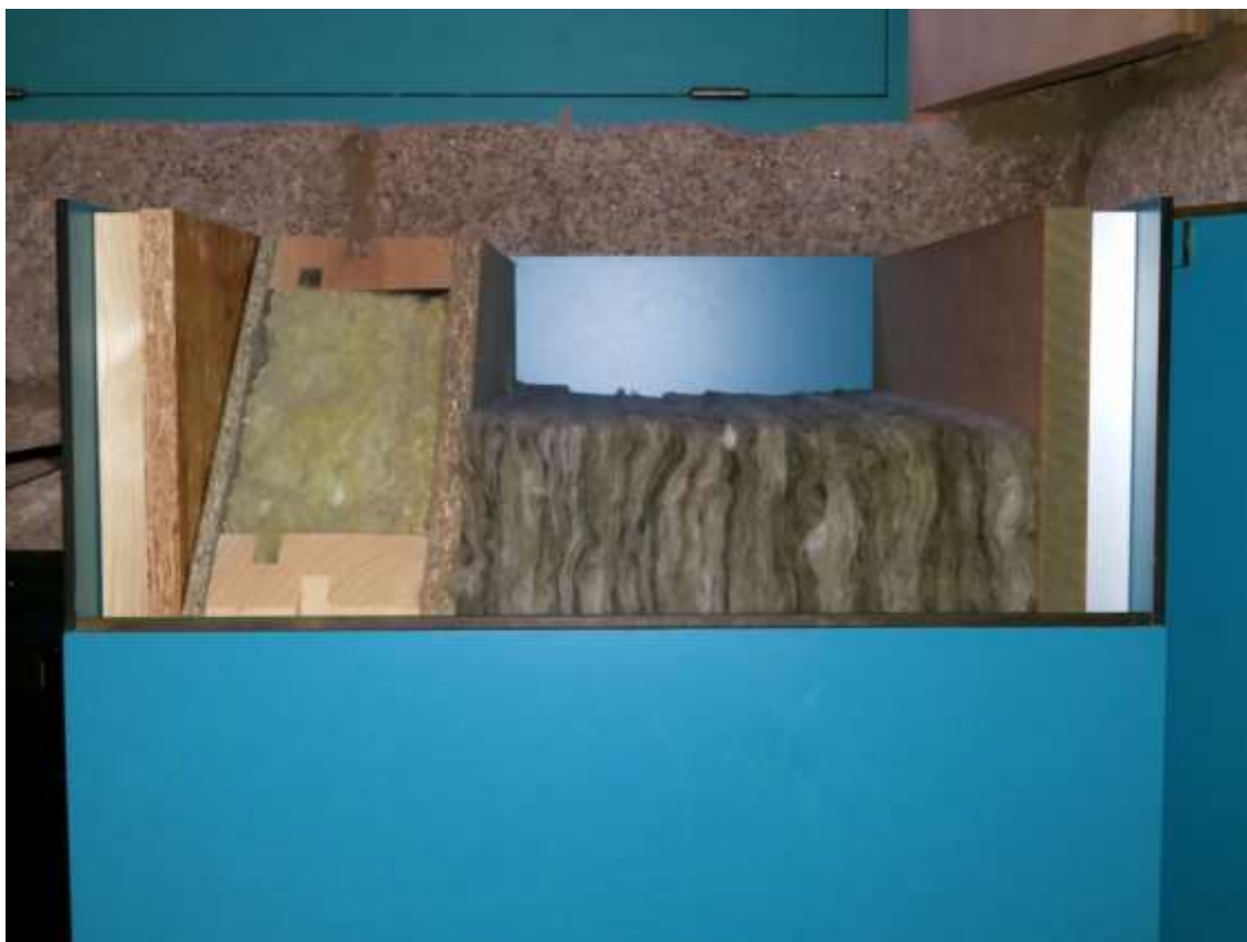
Maqueta de trabajo 1/1. Fachada vivienda pasiva.