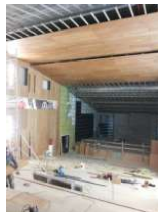
Lana mineral de roca.