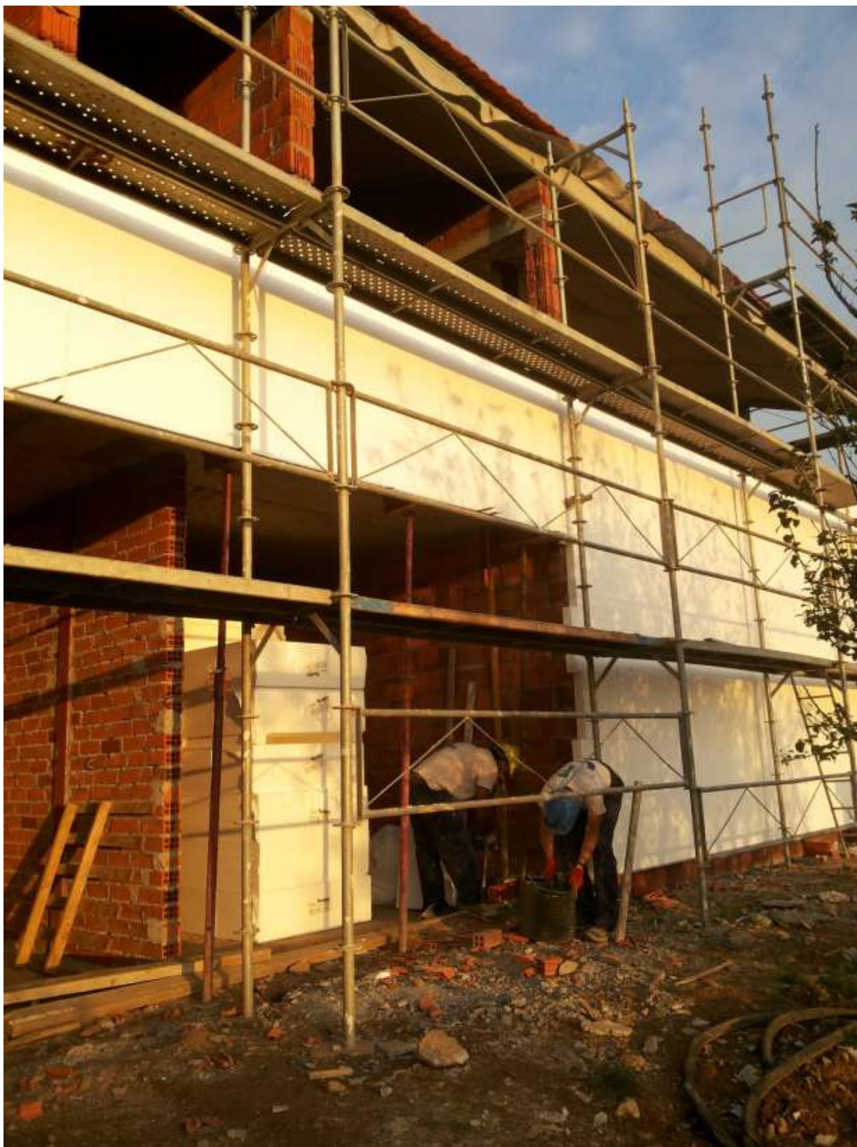
Módulo 3. Vivienda unifamiliar en Zamanes.