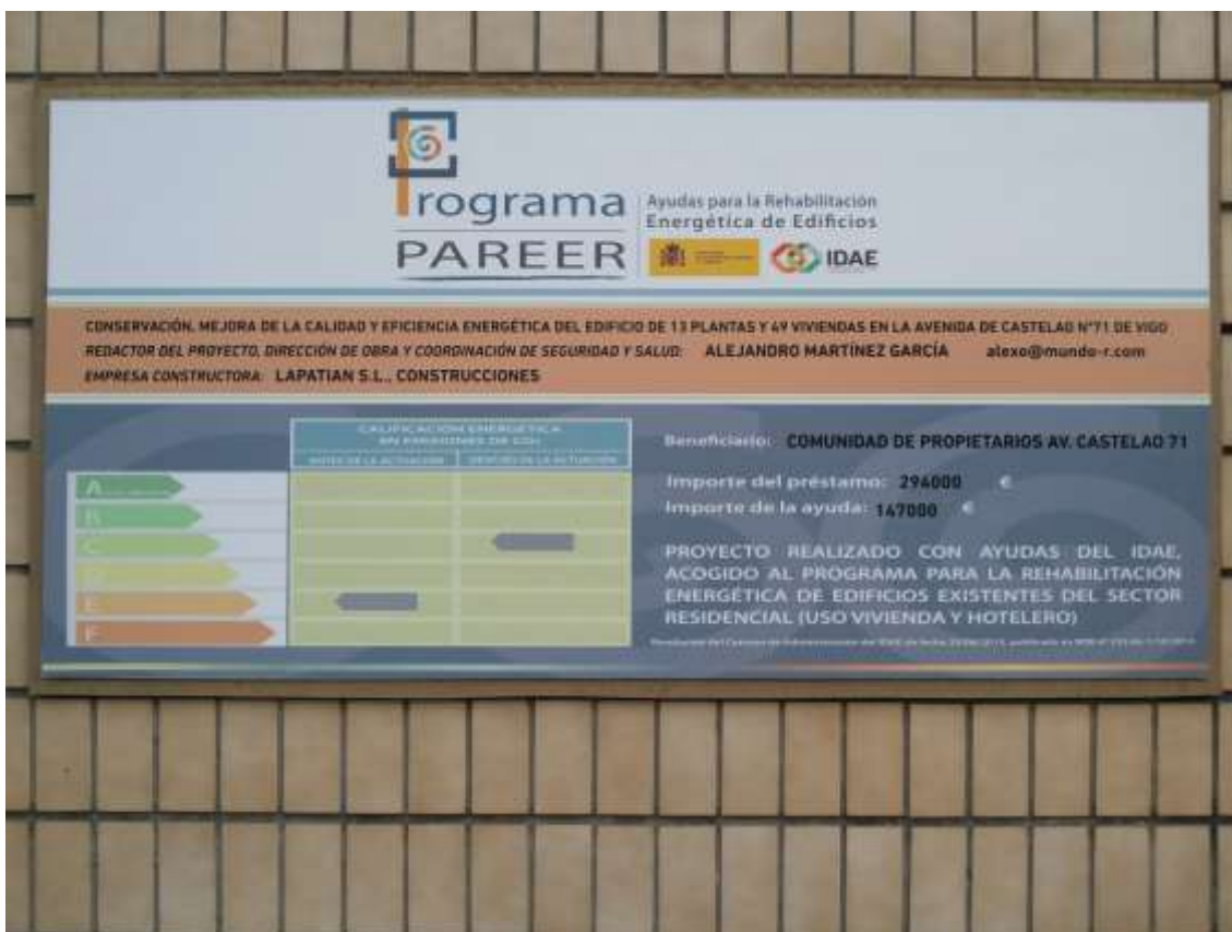
Módulo 2. Edificio de viviendas castelao 71.